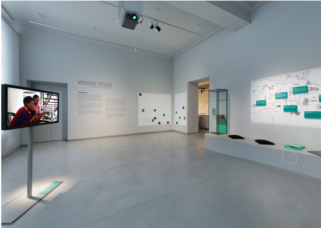
Installationsansicht „Wissen teilen“