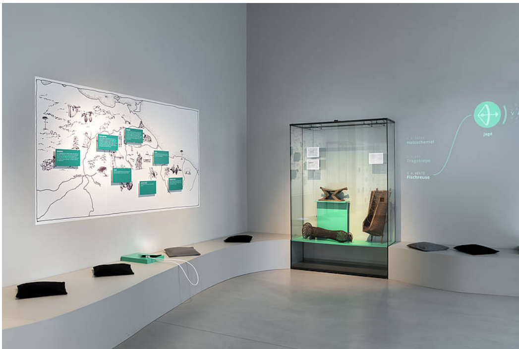
Installationsansicht „Wissen teilen“