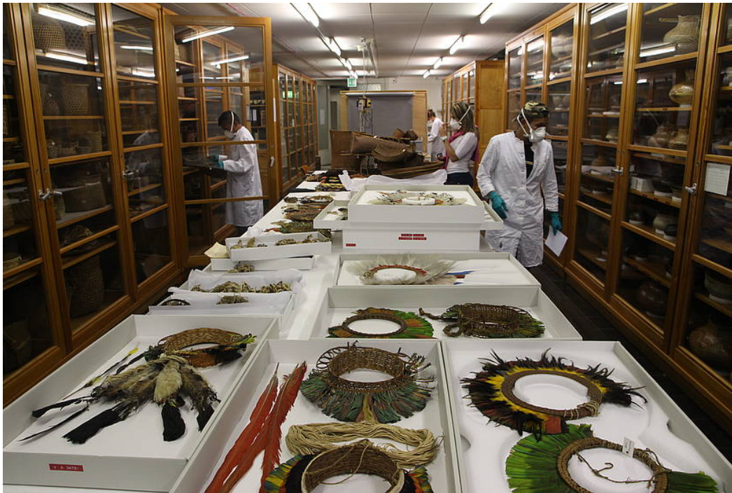
VertreterInnen der Universidad Nacional Experimental Indígena del Tauca bei der Arbeit im Museumsdepot, August 2014

Die präsentierten Texte sind unabhängige AutorInnentexte und geben nicht in jedem Fall die Meinung des Humboldt Lab Dahlem wieder. Die Rechte liegen, wenn nicht anders angegeben, beim Humboldt Lab Dahlem. Hinweis für die PDF-Druckversion: alle Links sind auf den entsprechenden Unterseiten von www.humboldt-lab.de abrufbar.